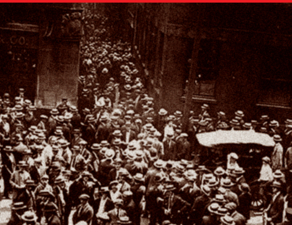
Народные волнения на Школьной улице в Бостоне рядом с офисом Чарльза Понци

ник знает, что строить пирамиды не хорошо, потому что это fraud, мошенничество. Однако если попросить уточнить, в чем же, собственно, это мошенничество состоит, большинство поборников экономической этики не найдет ответа. И в самом деле: что незаконного в финансовой пирамиде? Ответ настолько неожидан, что впору смутиться: весь уголовный аспект финансовой пирамиды просматривается только на уровне бухгалтерской терминологии! Да-да, именно так. В самом факте того, что Понци (Мавроди, Властилина и т.п.) раздавал долговые расписки с обещанием выплатить гигантские проценты, нет абсолютно ничего противозаконного. Во всяком случае, уж не больше, чем в обещаниях Карла Маркса везти пролетариат в светлое будущее на костях буржуазии. Криминал заключается в том, что деньги, выплачиваемые вкладчикам, именуются прибылью, тогда как на самом деле являются распределением капитала. Вот именно: прибыль вместо распределения. И больше ничего! Именно поэтому все новорусские пирамидостроители были так озабочены переименованием своих «мавроди-ков», стремясь во что бы то ни стало уйти от опасной темы кредитования и долговых обязательств. Так на свет появилось несчетное число вариаций на тему «касс взаимопомощи», которые наиболее эффективно позволяют бороться с обвинениями в пирамидостроительстве.