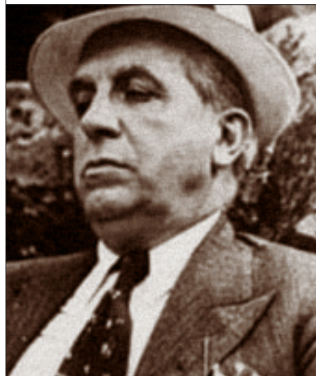
Схема родилась в самом конце 1919 года. В отличие от убогих российских эпигонов, Понци не кормил своих вкладчиков голословными обещаниями (публика иная — не поверила бы!),

ременная легенда об оборванце царских кровей, и энергичное масси-рование вымени всеамериканской мечты (изгои Старого Мира прибывают на Землю Обетованную без гроша за душой, но с огнем в глазах). Все это пошло до тошнотворности, однако действует безотказно в деле развода лохов: ведь каждая Золушка в глубине души полагает себя достойной волшебного принца — и по происхождению, и по благородству души. Когда Понци рассказывал сокровенные сказки репортерам, он посылал на подсознательном уровне важнейшее сообщение своим потенциальным инвесторам: «Мы с вами одной крови! Я, как и вы, не простой оборванец-иммигрант, а тайный принц голубых кровей, поэтому мы достойны лучшего!» 4 Мы должны немедленно стать богатыми, чтобы вос-